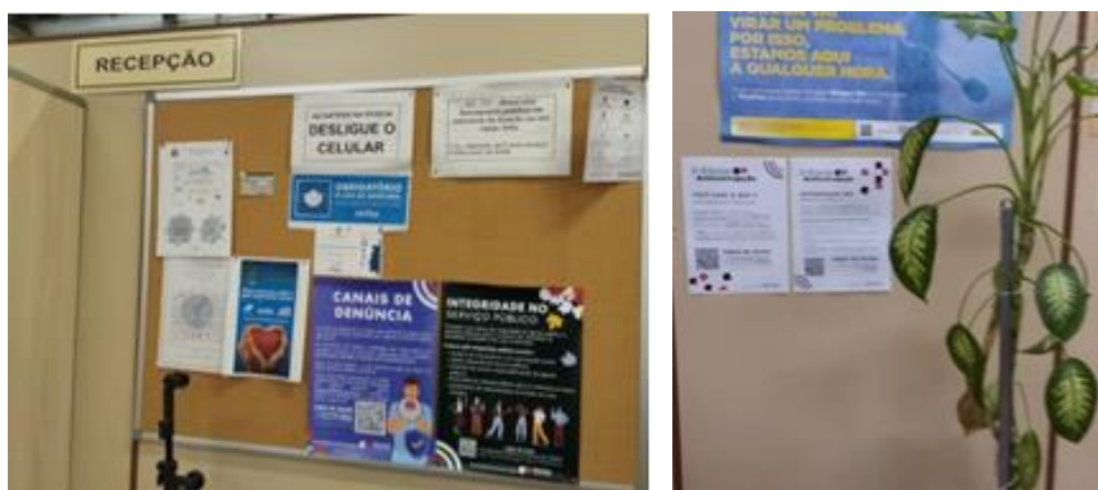
*Divulgação disponível na Recepção do DNA.