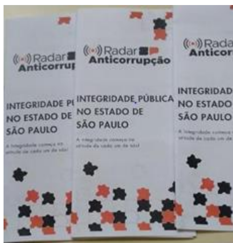
*Divulgação disponível no Centro de Recursos Humanos.