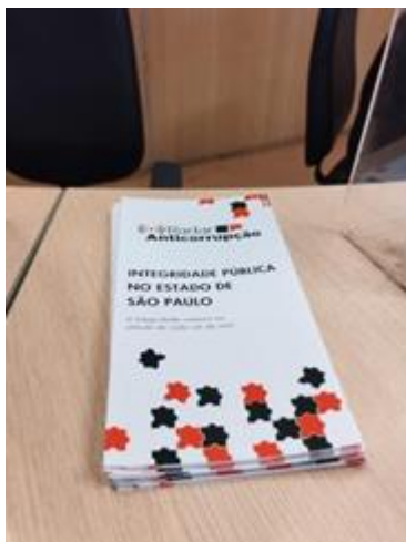
*Divulgação disponível na Recepção do IMESC.