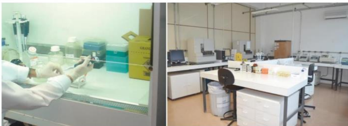
Núcleo de Perícias Laboratoriais