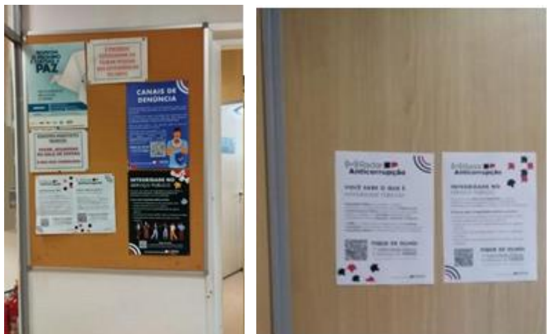
*Divulgação disponível no Rol de entrada do IMESC.